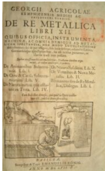
De re metallica