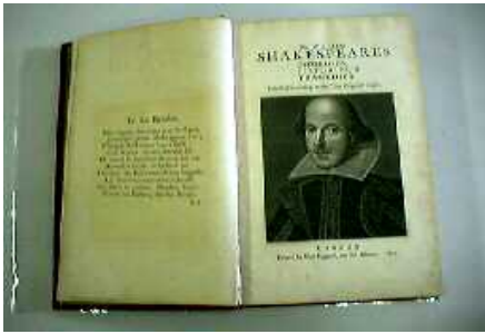
シェークスピアコレクション