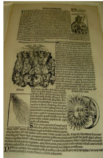
ガリレオ・ガリレイ コレクション