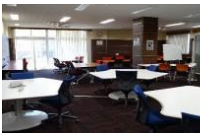
コモンズ (中央図書館)