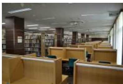
閲覧室 (中央図書館)