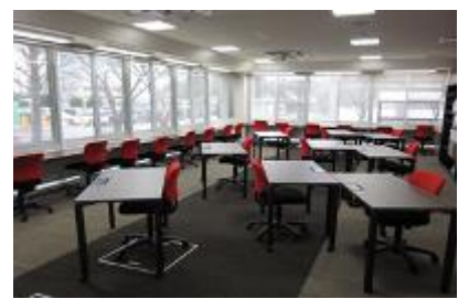
コモンズ (医学図書館)