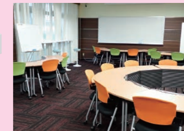
1階には、可動式のイスやテーブル、ホワイトボードなどを設置しています。自由に組み合わせて、グループ学習にご活用ください。