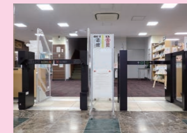
1階の入退館ゲートは一方通行です。入館ゲートは、利用者カード(学生は学生証)をかざすと開きます。1人ずつ通過してください。カードを忘れた方や未発行の方は、サービスデスクにお声がけください。