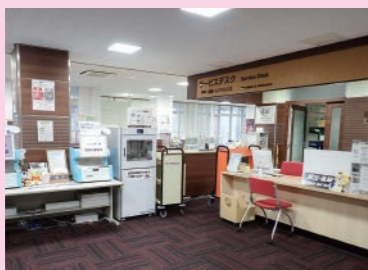
サービスデスクでは、館内の各種お問い合わせについてお答えいたします。なお、資料の貸出・返却期限の延長手続きは、自動貸出機をご利用ください。

一人で静かに学習する、本を読むためのフロア。よく利用される図書は、閲覧室の書架に集められています。