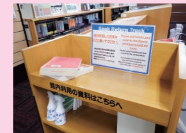
館内で利用した本は、館内各所に設置している返本台へ置いてください。